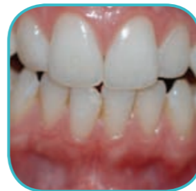
Μετά από 2 εβδομάδες χρήσης FlexCare.